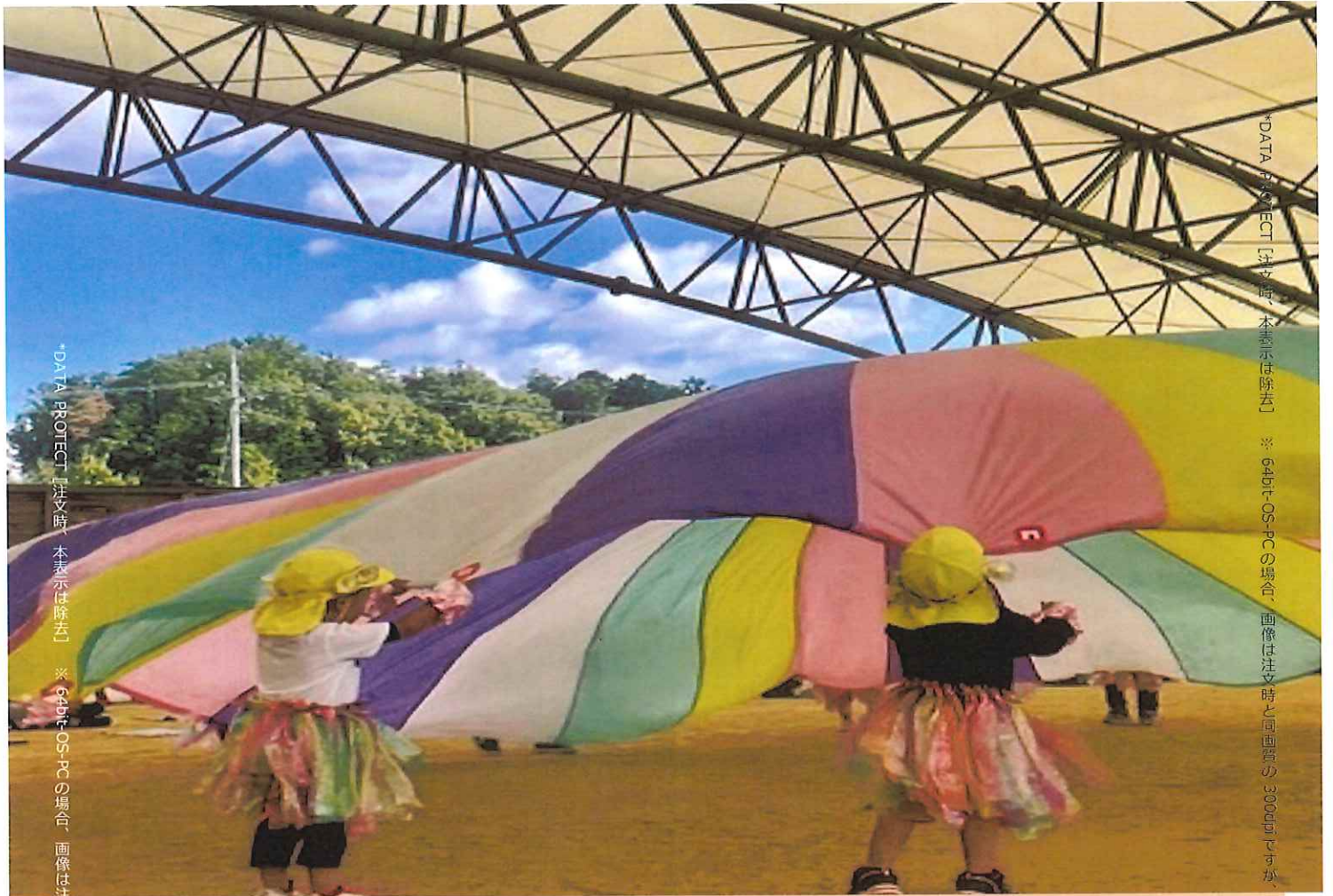
※ DATA PROJECT [注文時、本表示は除去] ※ 6bit-OS-PCの場合、画像は注文時と同画質の300dpiですが